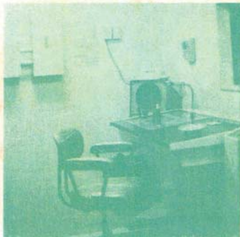
レントゲン操作室