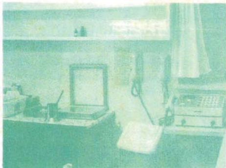
ナースステーション