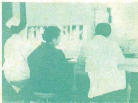
診 察 室